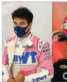
Imagen de Sergio Pérez.

La FIA y los organizadores del Mundial de Fórmula Uno informaron ayer que el mexicano Sergio Pérez, del equipo Racing Point, ha dado positivo por COVID-19 y no podrá competir este fin de semana en el Gran Premio de Gran Bretaña, en el circuito inglés de Silverstone, donde será reemplazado por un piloto cuya identidad aún no ha anunciado la escudería.