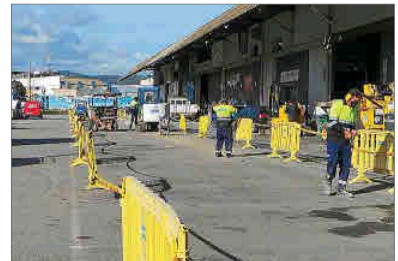
Los operarios han empezado a habilitar el espacio.