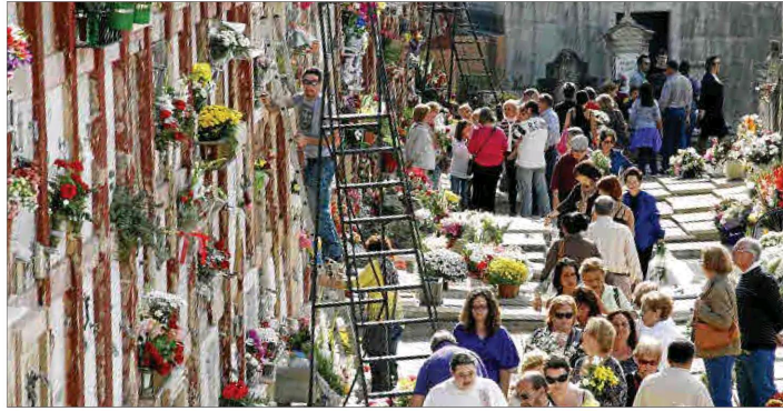
El cementerio de Palma registra en Tots Sants la visita de hasta 20.000 personas.