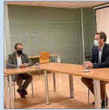
Yllanes e Hila, ayer reunidos.

La Federació de Veïns Ciutat de Palma se ha reunido con el obispo de Mallorca, Sebastià Taltavull, con el objetivo de establecer lazos de colaboración entre la entidad y la diócesis. La Federación trasladó la necesidad de colaborar entre las parroquias y entidades vecinales de los diferentes barrios de la ciudad.