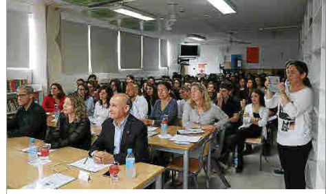
El jurado y el público siguió atentamente todas las presentaciones.