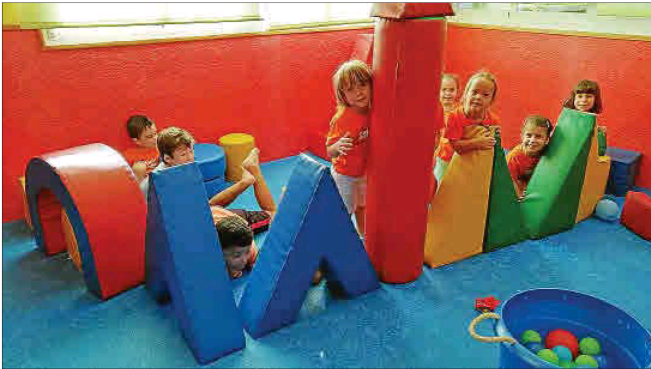
Los niños no pararon de jugar y de disfrutar con cada una de las actividades.