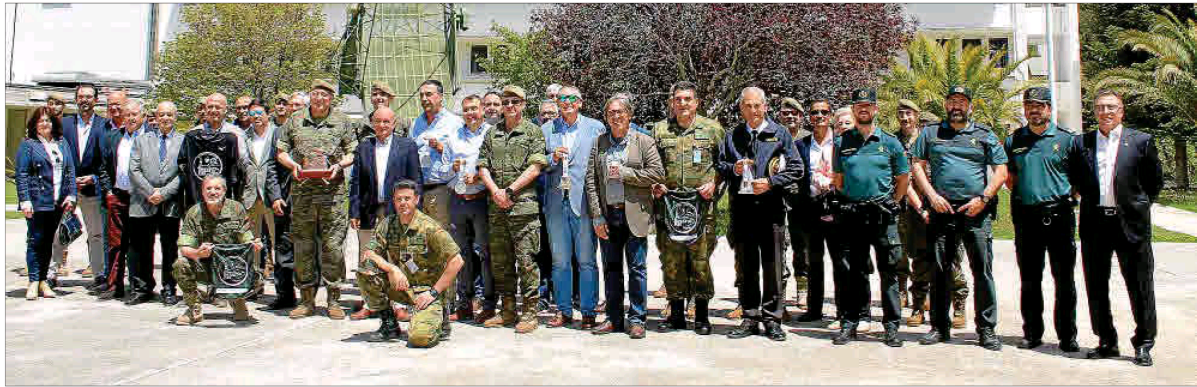
Presentación. En la imagen, los asistentes a la puesta de largo del III Desafío FAS posan en las instalaciones del EVA 7, en las faldas del Pug Major. El comandante general de Balears, Juan Cifuentes, junto a los alcaldes de Sóller, Fornalutx y Escorca y diferentes autoridades militares, miembros de la FBME y patrocinadores acudieron a la cita.