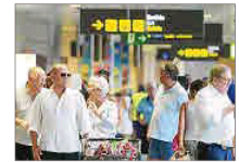
Hoy habrá 174.614 pasajeros.

Banca March ve un «nicho de mercado» en la financiación inmobiliaria en el mercado español, así como en las residencias de ancianos, en un contexto «que obliga a buscar formas distintas de invertir». La entidad propone invertir en activos ligados a la economía real y basados en megatendencias ante la desaceleración económica. • R.L.