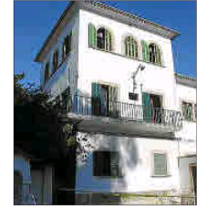
Imagen del antiguo cuartel.