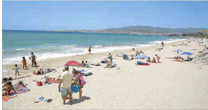
Can Pere Antoni y Ciutat Jardí estuvieron cerradas al baño, pero ayer se reabrieron tras las analíticas.

En la tercera planta de Cort han comenzado las obras para repartir el espacio entre todos los partidos, uno más que la pasada legislatura. El PP cede parte de su sitio a Vox, junto a ellos estará Cs. Podemos se queda el espacio que tenía el PSOE, partido que se muda a donde estaba Cs y Més mantiene su sitio.