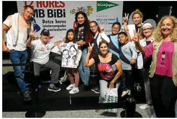
Fue todo un reto y lo pudo completar gracias a su esfuerzo y a la solidaridad de la gente.