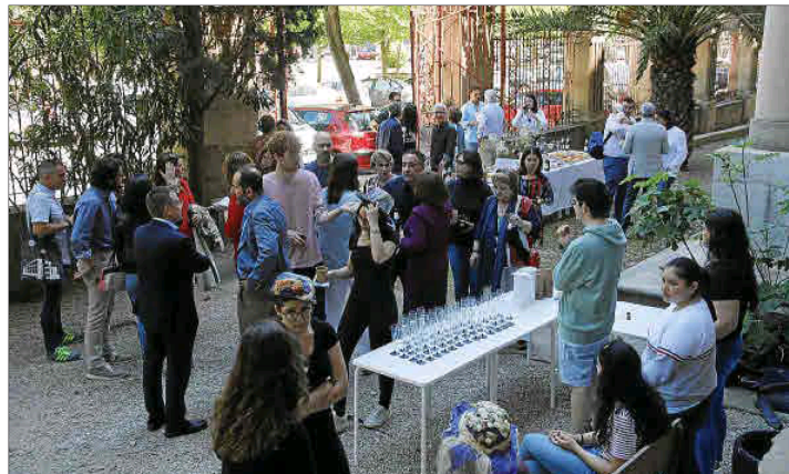
Ayer se pudo visitar la exposición de los proyectos finalistas y de los ganadores de las tres categorías.